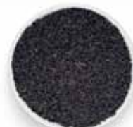
No 32 τρούφα