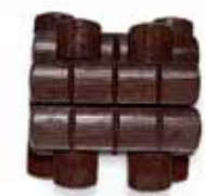
Απομίμηση σοκολάτας standard (27-30) σε μπαράκια