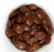
Latte σε κουμπιά