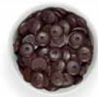
Κουβερτούρα σε κουμπιά