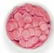
Σοκολάτα με γεύση φράουλα σε κουμπιά