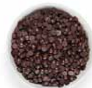
No 32 Special απομίμηση σοκολάτας σε σταγόνες