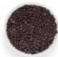
Delight: Σοκολάτα κατάλληλη & για ψήσιμο σε σταγόνες ≈ 1/18.000