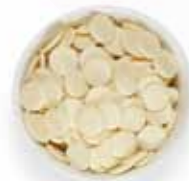
Premiera λευκή σε κουμπιά