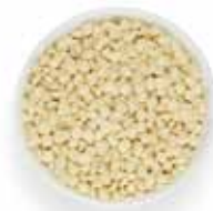
Σταγόνες Λευκής σοκολάτας